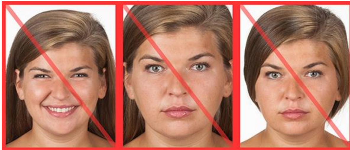
nienaturalny wyraz twarzy