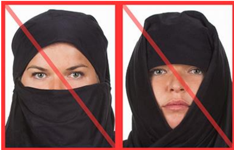
zakryty owal twarzy