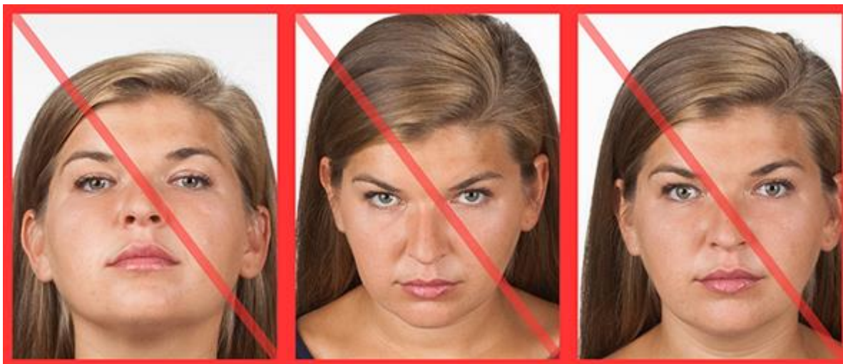
tzw. żabia perspektywa