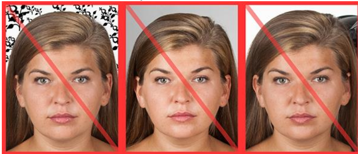
wzór w tle