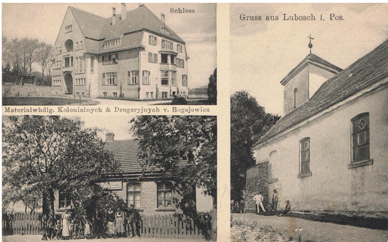
Lubosz na początku XX w. Karta pocztowa.