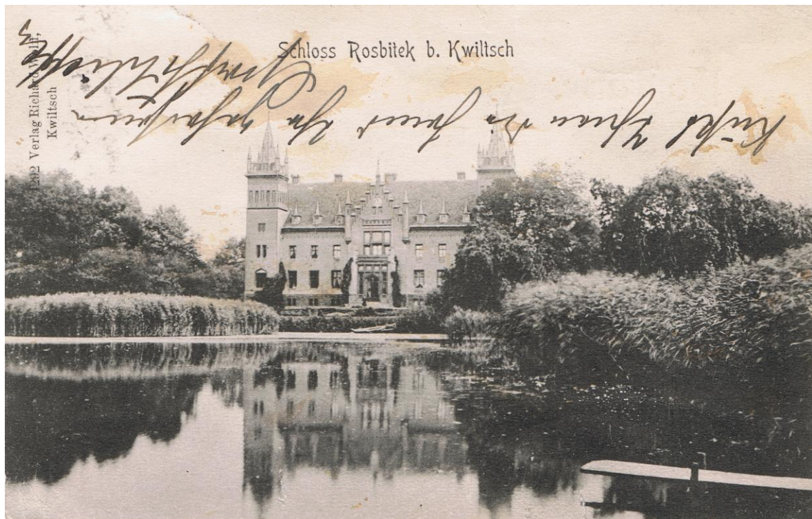
Pałac w Rozbitku od strony stawu. Karta pocztowa z początku XX w.

Z połowy XIX w. pochodzą dwa neogotyckie pałace w Rozbitku i w Wituchowie. Pałac w Rozbitku, pochodzący z lat 1856-68, wiązany jest z postacią z kręgu wybitnego architekta niemieckiego Fryderyka Augusta Stillera. Stanowi on obecnie własność prywatną i jest w trakcie prac remontowych. W 2003 i 2004 r. wykonany został kapitalny remont konstrukcji dachowej, wykonano nowe pokrycie dachowe z dachówki karpiówki, wykonano remont wież połączony z rekonstrukcją dawnego wyglądu hełmów. W kolejnych latach prace remontowe objęły również wnętrze pałacu i adaptację na cele kulturalne i edukacyjne. W przyszłości planowana jest rewitalizacja paku przypałacowego. Stan obiektu należy ocenić na bardzo dobry.