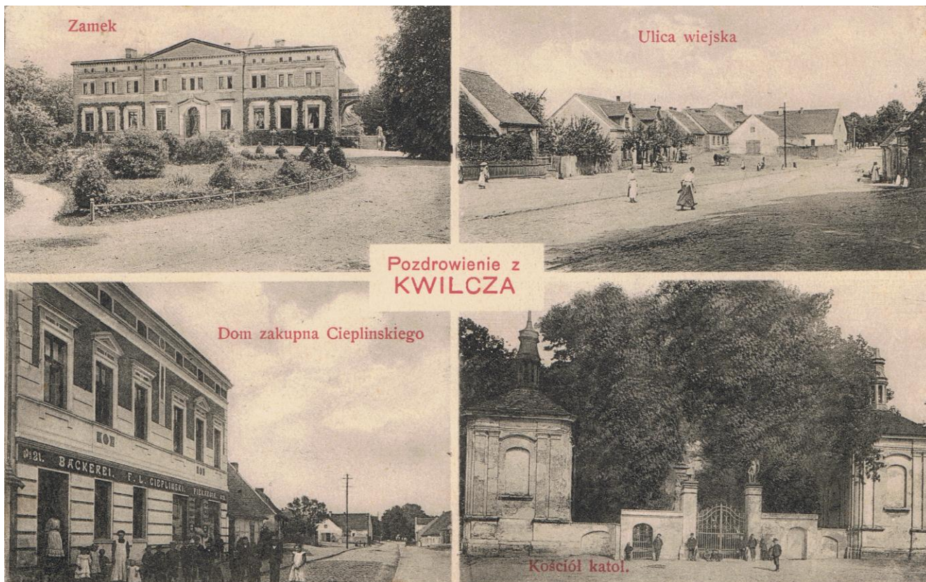
Pocztówka z początku XX w. z widokami z Kwilcza.